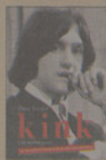
KINK Una autobiografía Dave Davies Lenoir