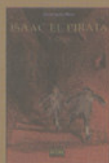
Isaac el Pirata Christophe Blain Norma