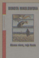
Blanco nieve, rojo Rusia Dorota Maslowska Ed. Mondadori