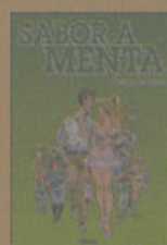
Sabor a menta Carlos Giménez Glénat

"Olga" se titula la tercera entrega de las desventuras en el siglo XVII del pintor Isaac Sofer, de su prometida Alice y de Jean, el sanguinario pirata. Sabemos más de los misterios que les rodean pero todavía no se divisa el cierre a esta magnífica serie. Las páginas se devoran en un periquete y saben a poco. Blain logra embucar a los lectores con abordajes de barcos, pero sobre todo con despiadados abordajes del alma humana. ■ Q.P.